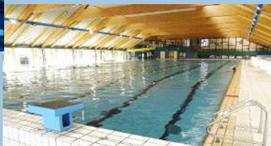
PISCINA MOUSCRON - BELGIQUE