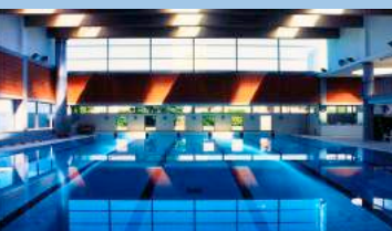
PISCINA MONS-EN-BAROEUL (59)