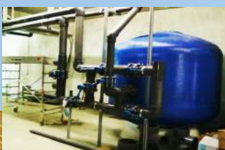
PISCINA CARROZ D'ARRACHES (74)