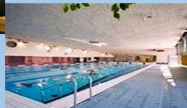
PISCINA CALAIS (62)